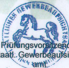
Prüfungsvorsitzender Staatl. Gewerbeaufsichts- amt